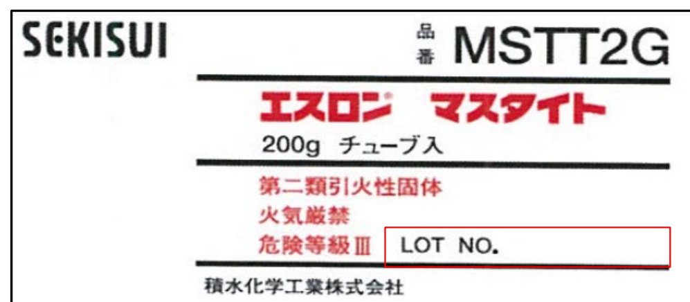
図-2 ダンボール表記