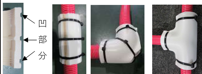
結束バンドの場合