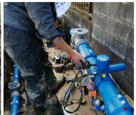
テスト施工現場 その③