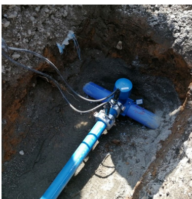
長野県伊那市様 テスト施工現場

ご採用いただいた多くの事業体様において、管工事組合様など、実際に施工いただく業者様にも給水耐震化、長寿命化の必要性をデモ、説明会開催により認知いただき、その施工性を含めて「納得」の上でご採用いただくケースが増えています。