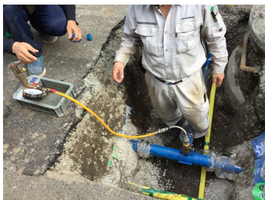
テスト施工現場その②