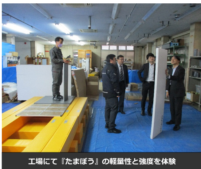
工場にて『たまぼう』の軽量性と強度を体験