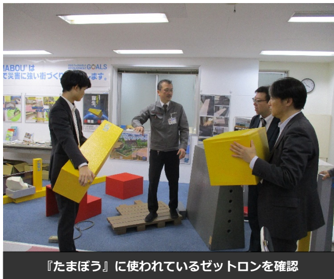
『たまぼう』に使われているゼットロンを確認

そして標準化と単純に言っても防水としてのポリウレアの標準化と躯体保護の標準化のふたつがあります。セキスイさんのもっている素材と組み合わせればもっといろんなことが出来るはずですよ。この素材とポリウレアを組み合わせればこうなるんじゃないか、というアイデアがいっぱい出てくるはずですよ。そうなればゼットロンも凄い市場になると思いますので宜しくお願いたします。今後は量産化を視野に入れて各所に提案していきたいと考えています。弊社製品の量産化は「ゼットロンを使用したリムクロンから」と標準化支援のスタッフにはお話ししています。ゼットロンにポリウレアをコーティングしたリムクロンがこれからの防水工法の主流になれば嬉しいです。