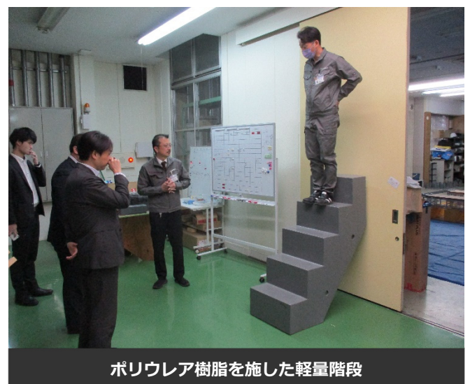
ポリウレア樹脂を施した軽量階段