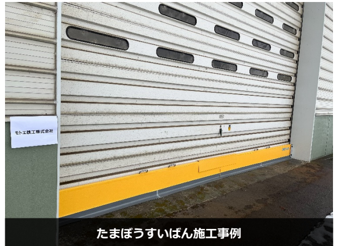
たまぼうすいばん施工事例

2020年8月、石川県小松市で手取川・梯川が氾濫した時に主要道路が水に浸かってしまいました。実際には溢れた水が直接家に入ってくるわけではなく、冠水した道路を車が走行します。そうすると波が起きて、その水が入ってきたのです。その波を防ぎたい、という多数の要望を聞きました。波を防ぐだけなら製品重量も強度もそこまでのものは要らない。その結果『たまぼうすいばん』を開発しました。この製品は富山県の発明協会でも賞ももらっています。