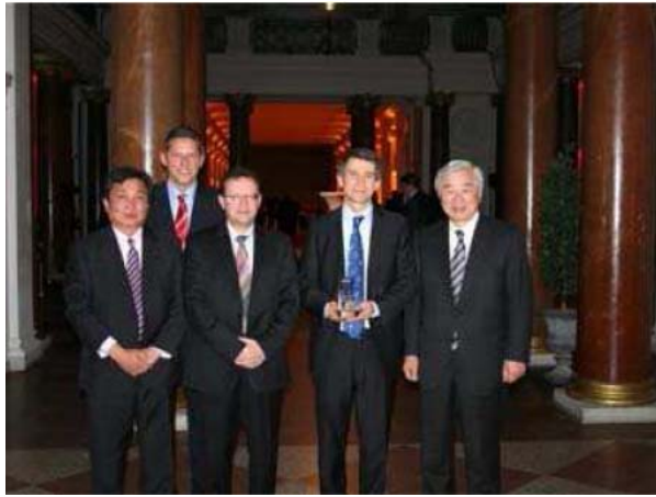
国際非開削技術賞受賞の記念撮影